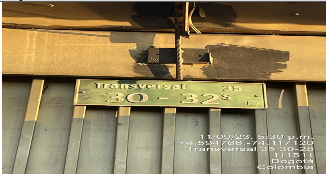
Fotografía No. 1

Nomenclatura del predio donde se encuentra ubicado el establecimiento de comercio.