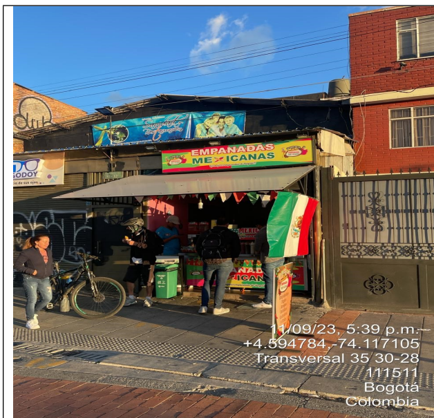
Panorámica donde se encuentra ubicado el establecimiento LA CASA DE LA EMPANADA MEXICANA.