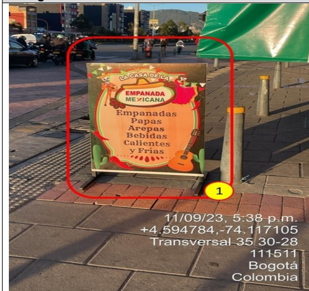
Elemento ubicado en área que constituye espacio público, en el cual se evidencia PEV.