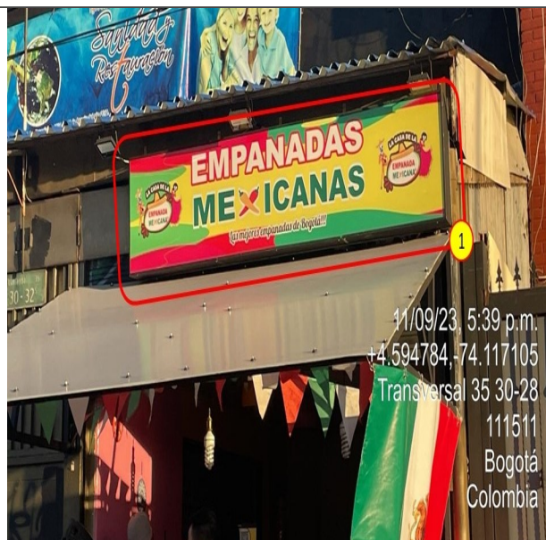
Elemento de publicidad tipo aviso en fachada, el cual no cuenta con registro de publicidad exterior visual de la SDA.